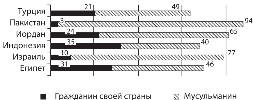
Рис. 3. Ответы респондентов на вопрос: «Кем Вы считаете себя в первую очередь?» (%).

Во многом подобная самоидентификация обусловлена спецификой современных мусульманских стран-доноров. Данные свидетельствуют о несформированности у жителей этих стран гражданской идентичности и идентификации последних в большей степени с исламом (Muslim-Western Tensions..., 2011) (рис. 3).