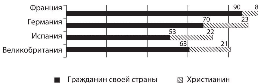
Рис. 4. Ответы респондентов на вопрос «Кем Вы считаете себя в первую очередь?» (%)

цев во многом обусловлены исторической трансформацией взаимоотношений государства и религии, а также официальной позицией правительств европейских стран, старательно проводящих «демаркационные линии» между этими институтами. Само европейское общество является в значительной степени секуляризованным, а значит, социально приемлемым/одобряемым для европейцев является нерелигиозное поведение и взгляды (Ibid.) (рис. 4).