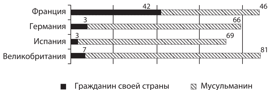
Рис. 2. Ответы респондентов на вопрос «Кем Вы считаете себя в первую очередь?» (%).

Во многом подобная самоидентификация обусловлена спецификой современных мусульманских стран-доноров. Данные свидетельствуют о несформированности у жителей этих стран гражданской идентичности и идентификации последних в большей степени с исламом (Muslim-Western Tensions..., 2011) (рис. 3).